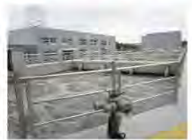
在进行曝气的生化池

我公司凭借雄厚的综合实力以及创新技术，成功中标此项目工程。该项目的设计规模为1.5万吨/日，为使出水水质达标，我公司采用MBR工艺，是目前国内采用MBR处理工艺规模最大的工程之一。该项目所使用的生物膜是由美国GE公司生产的世界顶级生物膜，出水指标远低于国家一级A标准。同时该工程已被定为“膜工艺样板工程”，并于厂内建造了一座膜展示馆供参观学习。